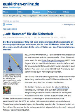
Kölnner Stadtanzeiger · 09.05.2011